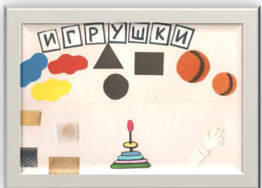
Пример мнемотаблицы №7