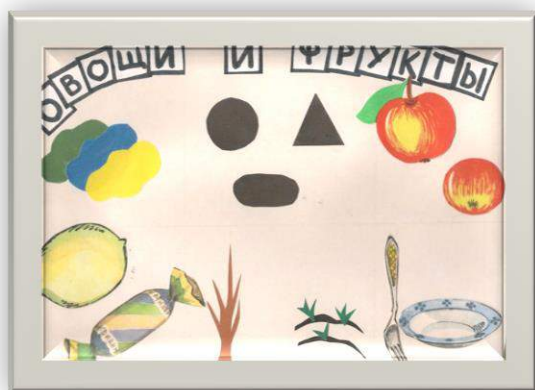
Пример мнемотаблицы №5