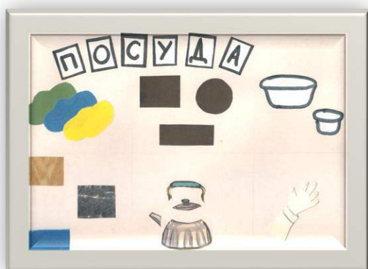
Пример мнемотаблицы №3

Пример создания ребёнком мнемотаблицы для составления рассказа-описания, используя технику аппликации: