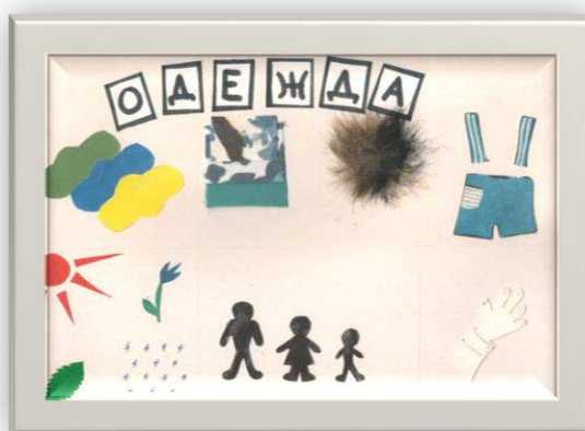
Пример мнемотаблицы №6