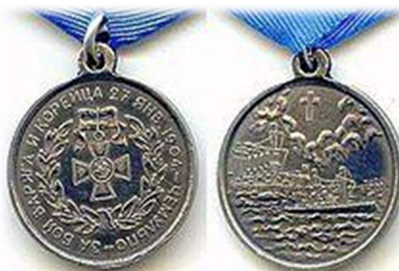
Рис. 5. Медаль «За бой “Варяга” и “Корейца”» 27 января 1904 года»