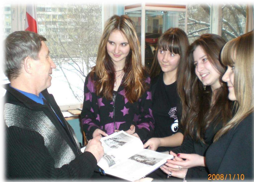
Рис. 2. Писатель Виктор Катаев посетил наш музей и подарил нам свою книгу «Крейсер “Варяг”. Легенда Российского флота».