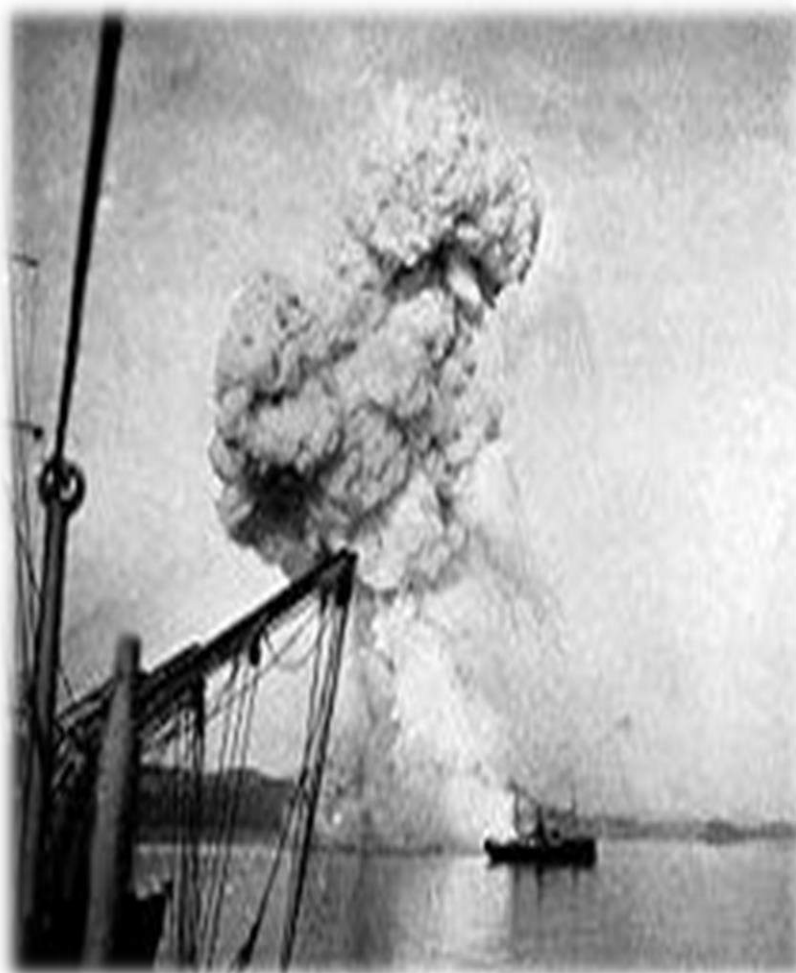
Рис. 4. Взрыв «Корейца».