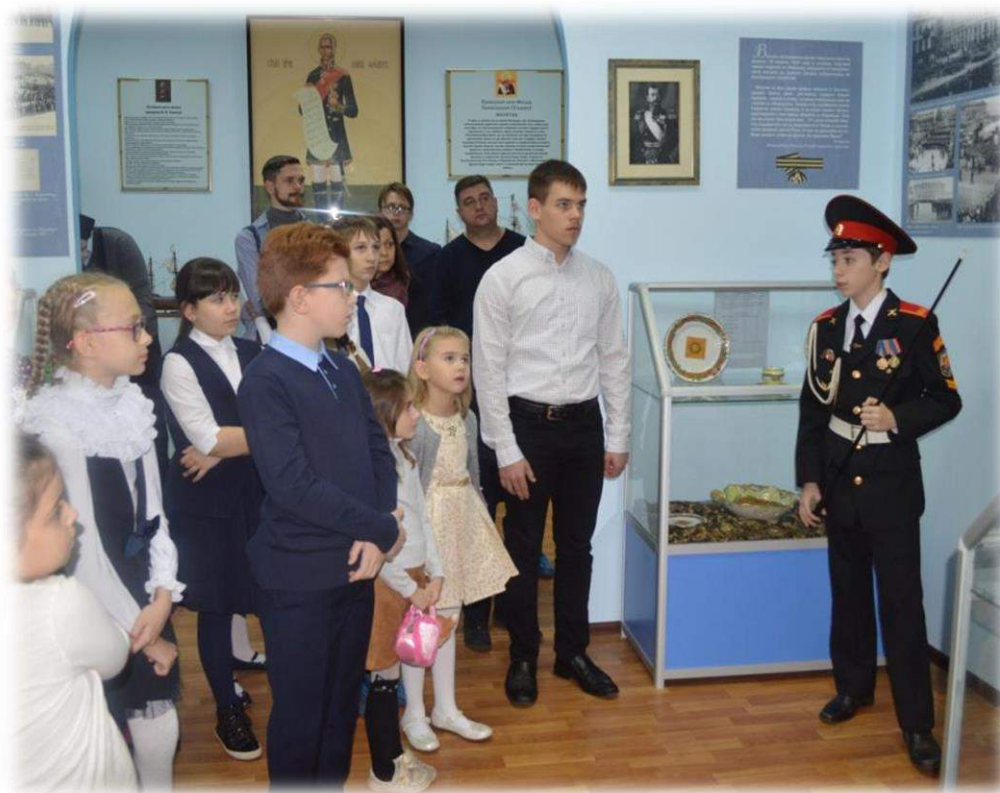
Рис. 1. Экскурсия в нашем школьном музее «Морской славы России».